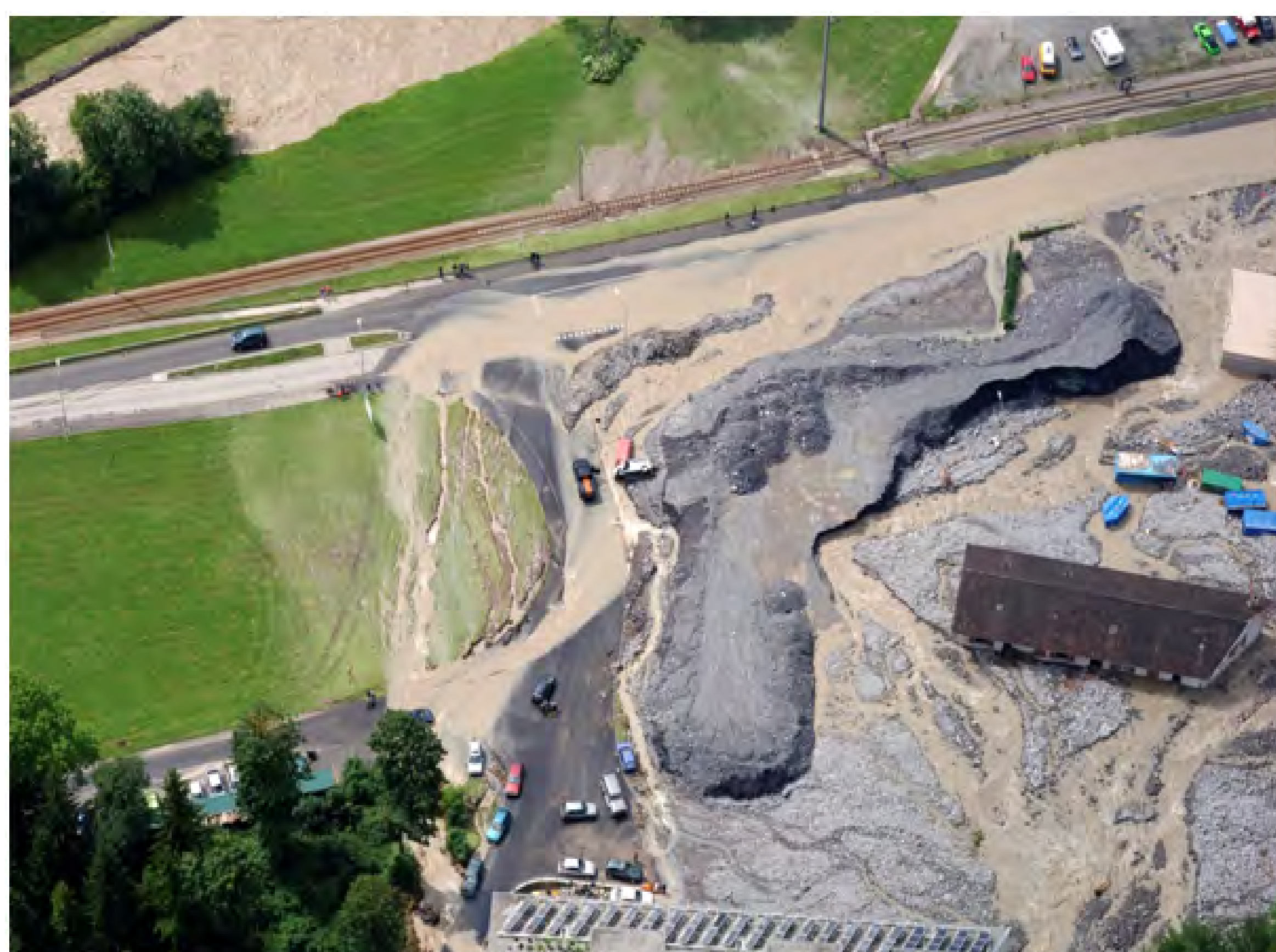
Unwetter 2005; Ablagerungen auf dem Schwemmkegel im Industriegebiet