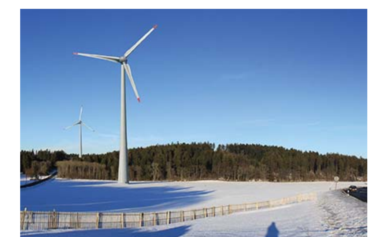
04 Parc éolien d'EolJorat