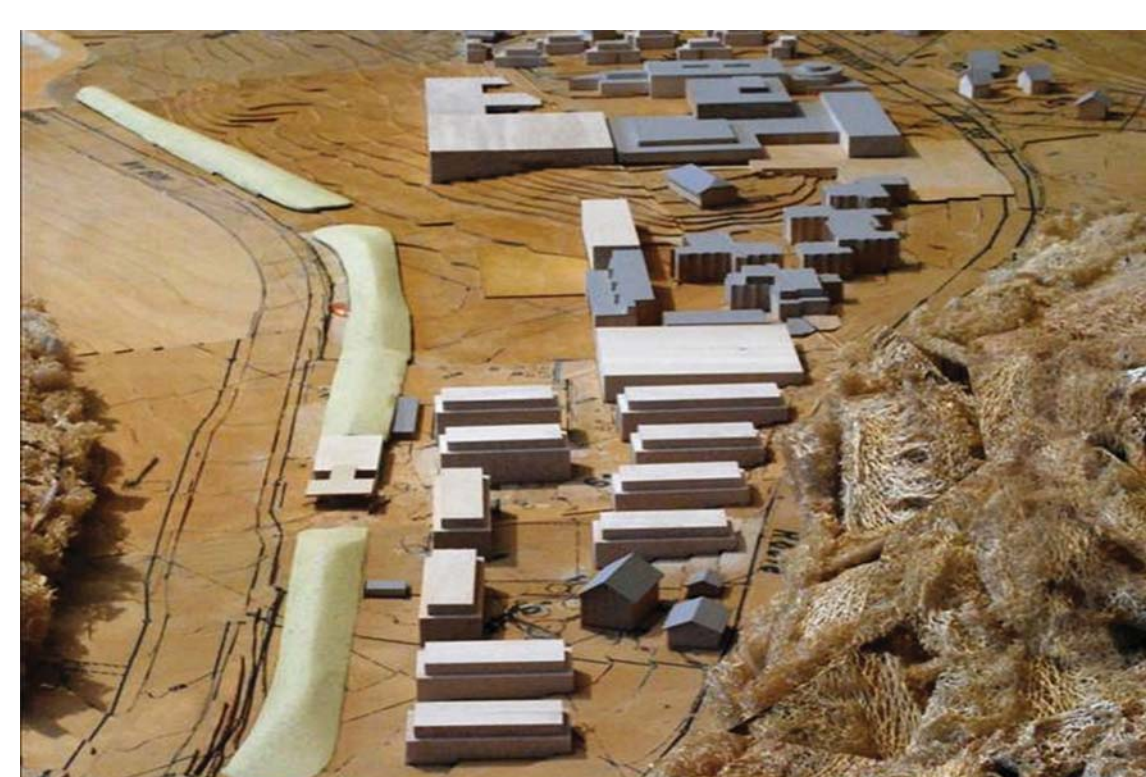
29 Développement de l'Ecole hôtelière de Lausanne - EHL