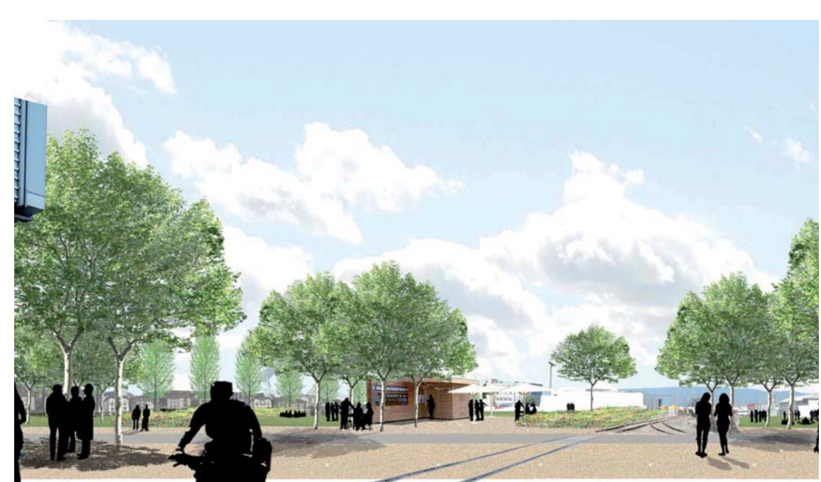
4 Revitalisation et développement du quartier de Sébellion - Sévelin