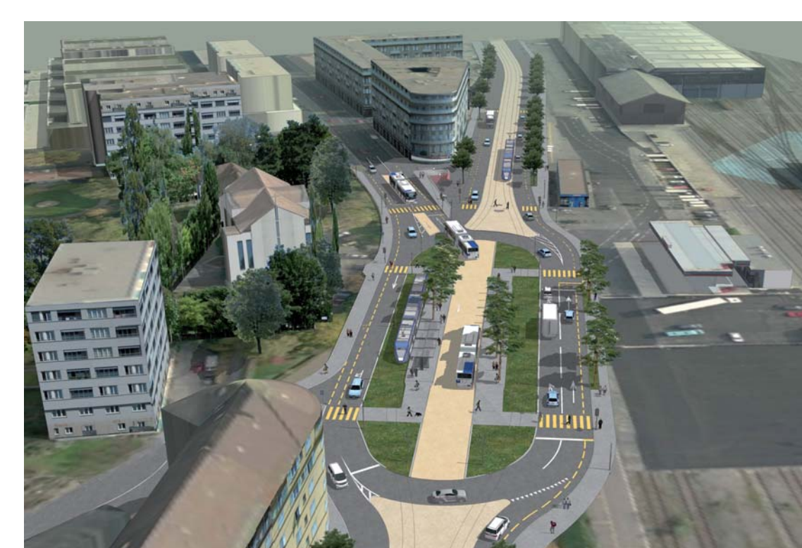
e f Axes forts de transports publics: tram t1 / BHNS