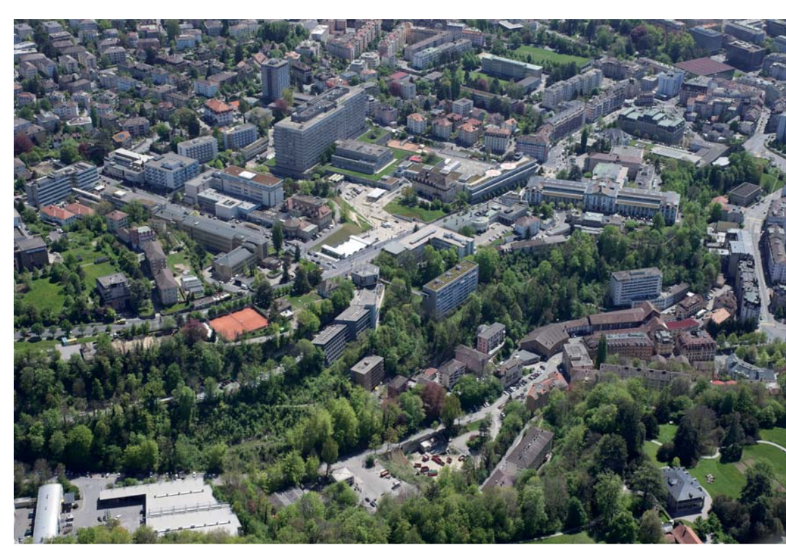
14 Revitalisation et développement du quartier du Vallon