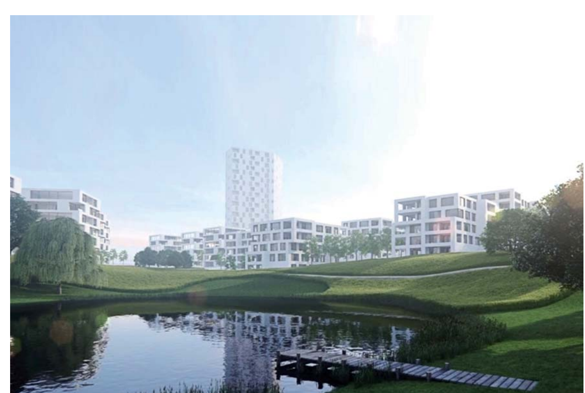
27 Nouveau quartier de Vernand - Camarès