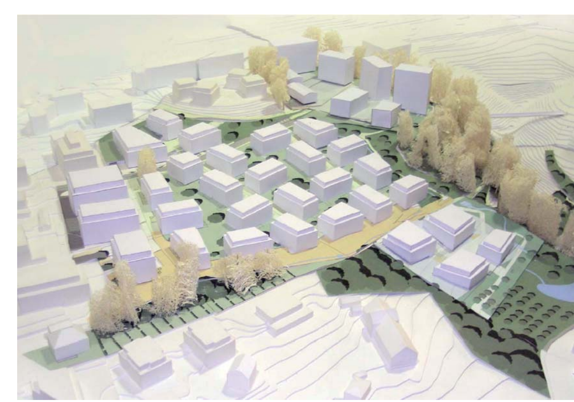
17 Nouveau quartier des Fiches